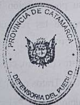
DALMACIO MERA DEFENSOR DEL PUEBLO PROVINCIA DE CATAMARCA

Sin otro particular, saludo a Ustedes con la mayor consideración.